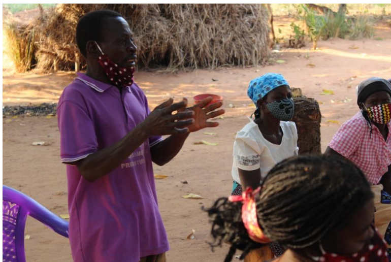
Foto: Momento de encontro comunitário de formação do comité de apoio de Laze- Mocuba

Comunidades de Mocuba e Lugela, implementam uma estratégia de monitoria e reporte do impacto social da COVID-19 com enfoque nos casos de violência baseada no gênero, a partir da organização em comités de apoio, constituídos por Homens e Mulheres, lideranças locais e pessoas influentes com vista a responder rapidamente à qualquer tipo de violência que acontece na comunidade agravada pelo impacto da pandemia.