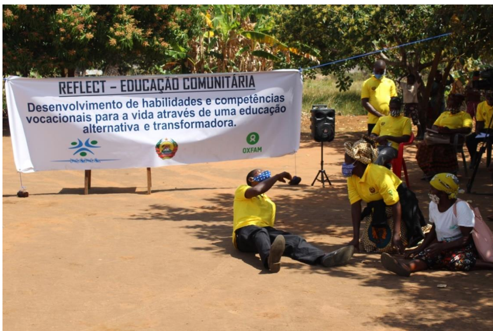
Foto: Demonstração de peça teatral pelo círculo REFLECT

O evento teve vários momentos interactivos como a Visita às Actividades desenvolvidas pelas comunidades resultantes dos aprendizados colhidos nos círculos de REFLECT (plantio de Ananazeiras, Exposição de Fogões melhorados de baixo consumo, produção de Mandioca de variedade melhorada e Feijão guar como culturas de rendimento); bem como a demonstração de Materiais didácticos de origem local usados nas sessões REFLECT para alfabetização de jovens e adultos, incluindo Feira agrícola apresentada pela comunidade e Apresentação de Peça teatral retratando problemáticas locais.