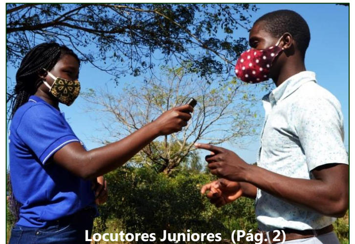
Locutores Juniores (Pág. 2)

Comunidades Monitoram e Reportam Casos de Violência Baseada no Gênero (VBG)