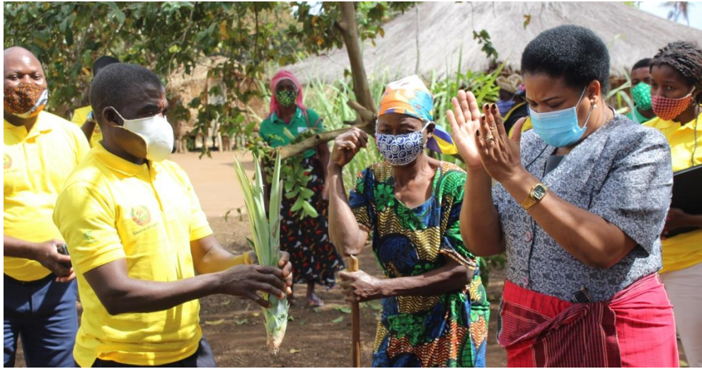
Foto: Facilitador, Membro do círculo de REFLECT e Administradora de Lugela prestes a plantarem de socas ananazeiras

O evento teve vários momentos interactivos como a Visita às Actividades desenvolvidas pelas comunidades resultantes dos aprendizados colhidos nos círculos de REFLECT (plantio de Ananazeiras, Exposição de Fogões melhorados de baixo consumo, produção de Mandioca de variedade melhorada e Feijão guar como culturas de rendimento); bem como a demonstração de Materiais didácticos de origem local usados nas sessões REFLECT para alfabetização de jovens e adultos, incluindo Feira agrícola apresentada pela comunidade e Apresentação de Peça teatral retratando problemáticas locais.