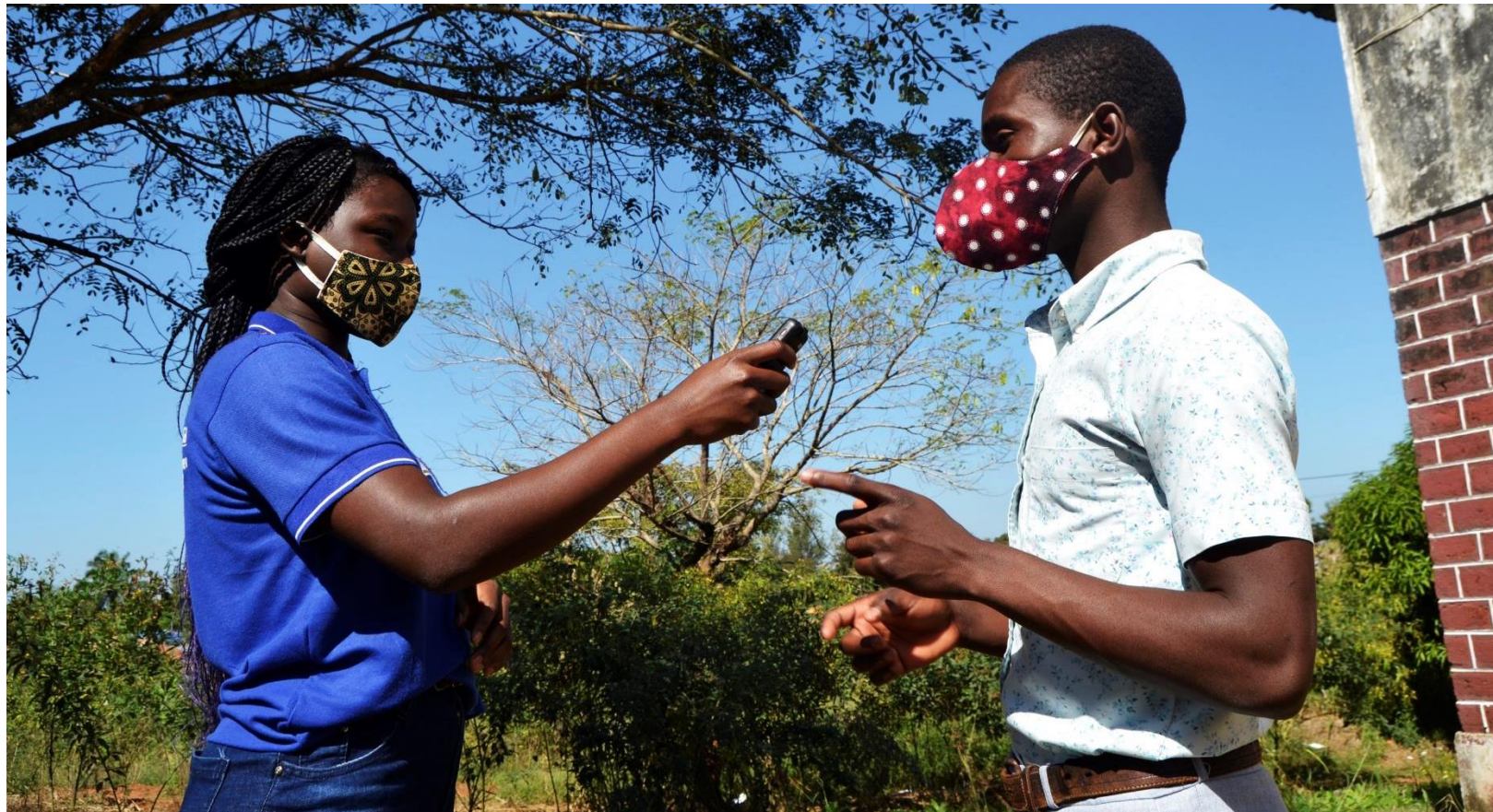
Foto: Momento de gravação de reportagem para o Programa “Vida Adolescente” - Lugela

No âmbito do fortalecimento de clubes escolares e Parlamento Infantil para a protecção e retenção e protecção da rapariga na escola, promovendo direitos a uma saúde sexual reprodutiva segura para adolescentes e jovens, especialmente a rapariga no contexto rural. A NANA, com apoio da Diakonia, no âmbito do programa AGIR, financiado pela Embaixada da Suécia, implementa a iniciativa Locutores Juniores comunicando de adolescente para adolescente através de um jornalismo interactivo feito de forma descontraída. Entre 7 e 10 de Julho, decorreu a primeira fase que consistiu no treinamento de raparigas e rapazes do clube escolar de Lugela sobre produção e apresentação de programas de rádio, envolvendo técnicas de recolha e sistematização de conteúdos, edição e sonorização para emissão. A iniciativa inclui o apetrechamento informático e sonoro.