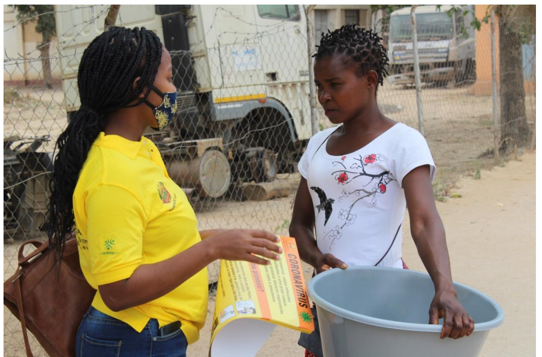
Foto: Activista da NANA em acção de sensibilização para o uso de máscara e para outras medidas de prevenção da COVID-19

Várias frentes foram criadas e a funcionarem com brigadas multisetoriais compostas por agentes da Polícia Municipal e de Protecção, Técnicos de Saúde e de outros sectores do Estado reforçados por Activistas em representação de várias OSC's destacadas para dar suporte na sensibilização, de forma contínua para a consciencialização popular sobre a prevenção da COVID-19.