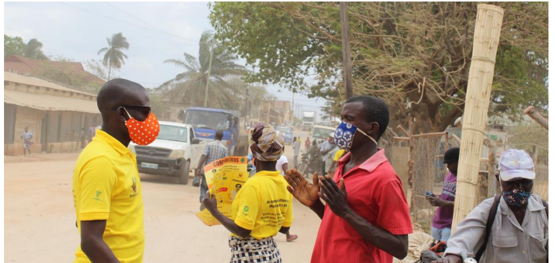
Foto: Cidadão interpelado apresentando argumentos do porquê não ter colocado a máscara mesmo tendo-a trazido consigo.

Com esta Campanha espera-se uma maior sensibilização popular nas suas variadas faixas etárias e contexto, com destaque nas vias públicas, praças e mercados como os principais focos de socialização e aglomeração em Mocuba.