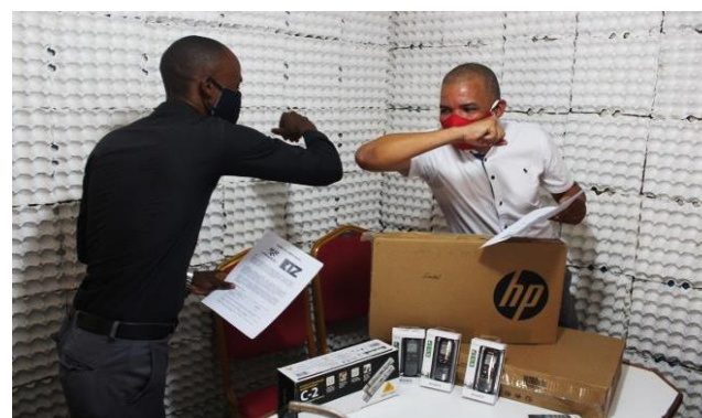
Foto: Assinatura de Memorando entre a NANA e a RTZ FM

Ainda neste âmbito, a NANA assinou Memorando com a RTZ FM, apoiando-a com o apetrechamento em material sonoro e informático, enquanto que a rádio garante o suporte técnico, tempo de antena e a visibilidade das intervenções do Parlamento Infantil, seguindo-se com o promissor compromisso de acompanhar os petizes na trilha de locução júnior, em especial a comunicação para a Saúde Sexual e Reprodutiva.