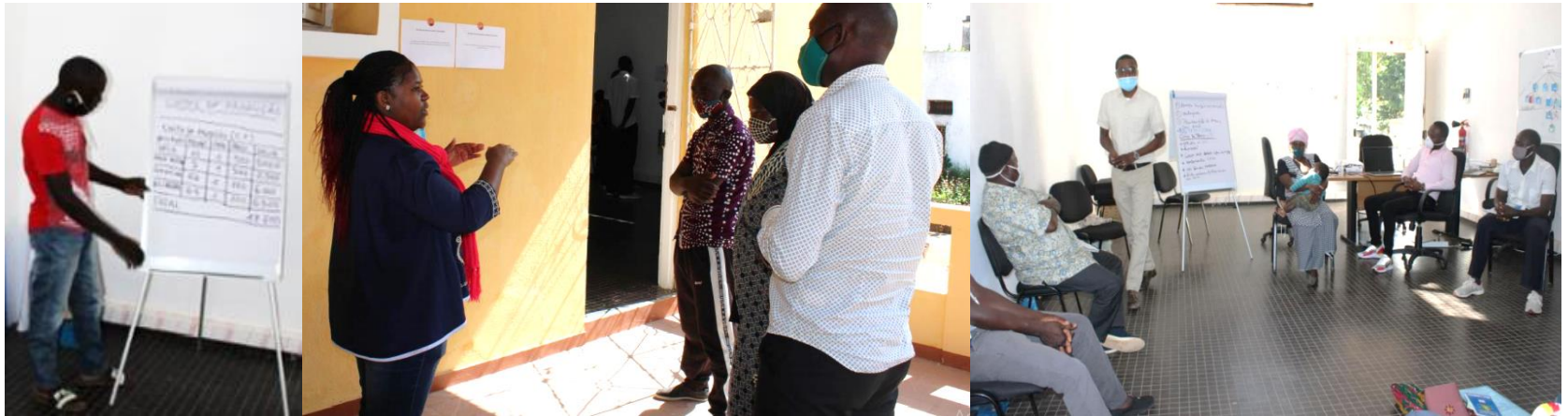
Fotos: Momentos de Sessão do treinamento

Membros da Associação de Produtores de Cajú de Murua (APROCAMU), apoiados pela Giz/Cooperação alemã, beneficiaram-se de um treinamento conduzido pela NANA, tendo apresentado uma proposta técnica de formação para 10 dias, envolvendo vários temas entre eles: i. Associativismo e cooperativismo, ii. Poupanças e créditos rotativos no modelo de ASCAS, iii. Empreendedorismos e planos de negócios iv. Modelo de monitoria e avaliação de resultados usando koBo Collect e Prevenção do Covid-19.