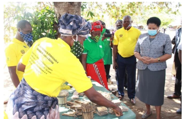
Foto: Amostra de material didáctico local

Trata-se da celebração do dia 8 de Setembro, Dia Internacional da Alfabetização e Educação de Jovens e Adultos acolhida pelo círculos REFLECT de Tandane como centro das cerimónias distritais do presente ano, um acto presidido pela Administradora do distrito de Lugela.