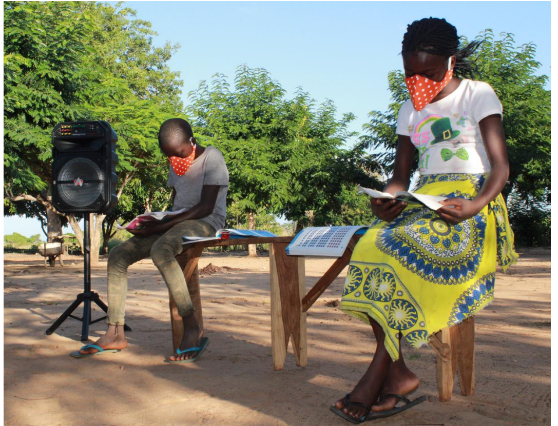
Foto: Meninos em momento de escuta de rádio-aula

Reconhecendo a importância da Educação na estabilidade social mesmo em tempos de pandemia, especialmente para pessoas menos favorecidas, a NANA, como parceiro do sector de Educação na Província da Zambézia, juntou-se a outras OSC's, IFP's e DPEDH, através da OXFAM, para preparação e selecção de conteúdos a serem leccionados via rádio.