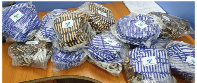
Foto: Lotes de máscaras entregues