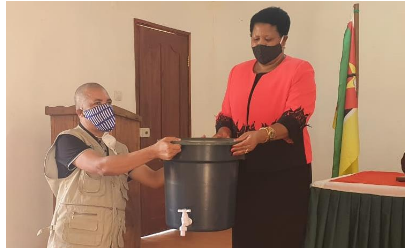
Foto: Momento de entrega de material (Dir. da NANA e Administradora do Dist. de Lugela)

Com esta intervenção, busca-se assegurar parte dos Direitos Humanos, amplamente defendidos pela NANA, beneficiando, fim a cabo, a toda sociedade.